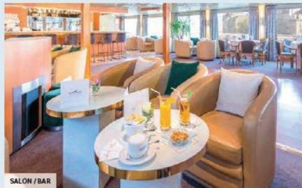
SALÓN / BAR

PUENTE SUPERIOR - 24 CAMAROTES con grandes ventanas panorámicas correderas