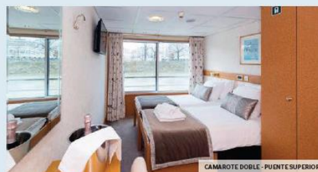
CAMAROTE DOBLE - PUENTE SUPERIOR

Nota: no hay servicio de lavandería a bordo.