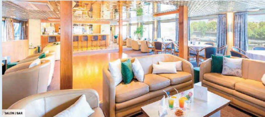
SALÓN / BAR

El pintor italiano Sandro Botticelli, uno de los grandes maestros del Renacimiento, a dadu su nombre a este elegante barco de 4 anclas que navega por el Sena, un río histórico y auténtico con paisajes de infinita riqueza.